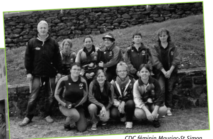
CDC féminin Mauriac-St Simon