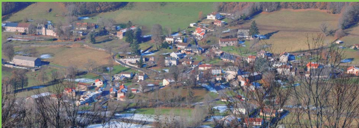
Le village de Beillac