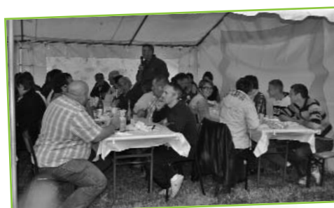
Fête de Boussac