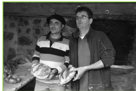
Fête des voisins

L'association Les Amis de Boussac vous souhaite de joyeuses fêtes de fin d'année.