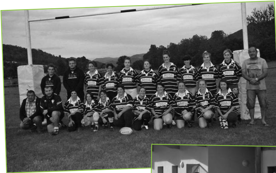
Le rugby se conjugue désormais au féminin à Saint Simon

Le fidèle public du Pontail toujours présent pour soutenir ses couleurs