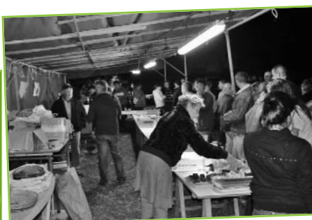
Soirée disco neige