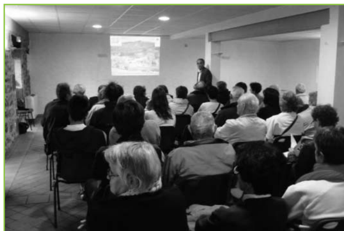
Réunion publique du 25 juin 2013