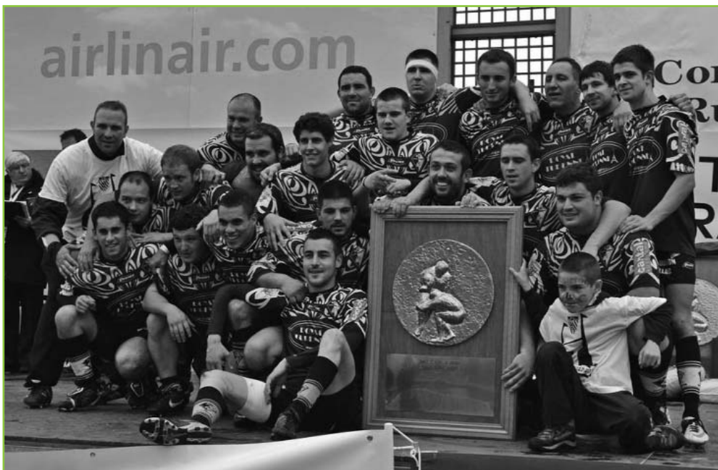
Nouveau bouclier pour l'équipe B sacrée championne du Limousin à Brive