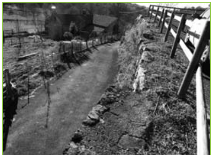
Parking de Boussac.