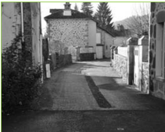
Rue des Terres Blanches.