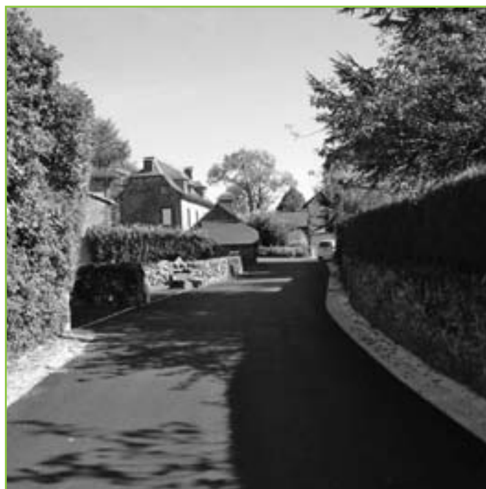
Village de Beillac.