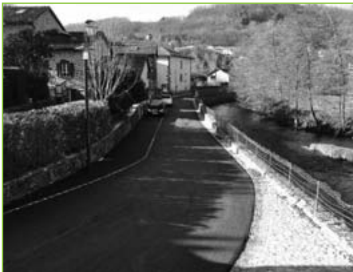
Chemin du bord de l'eau.

Chemin du Bord de L'Eau, rue Suzanne Robaglia, rue des Terres Blanches : enfouissement des réseaux secs et humides, reprise du réseau pluvial, pose de nouveaux candélabres, remise à neuf des chaussées en enrobé, création de caniveaux en galets, d'aires pour les containers, de places de stationnement ainsi que de ralentisseurs.