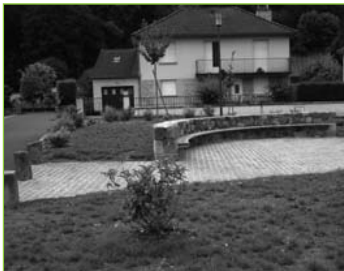
Espace de rencontres rue Pierre Moussarie.

Le Bourg : Cité Moussarie, Chemin de Vergnes, Route du Puy Mary.