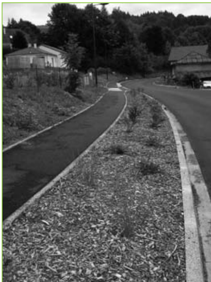
Route du Puy Mary.